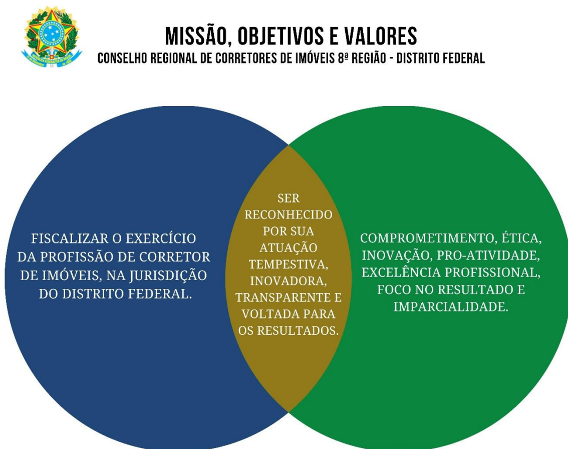
Figura 01 – Missão, Objetivos e Valores

O CRECI/DF foi criado pela Lei nº 6.530 de 1978, convocado e instalada nos termos da referida Lei e do seu Estatuto e tem poderes para deliberar sobre todos os ramos relativos ao objeto da autarquia e o mercado imobiliário.