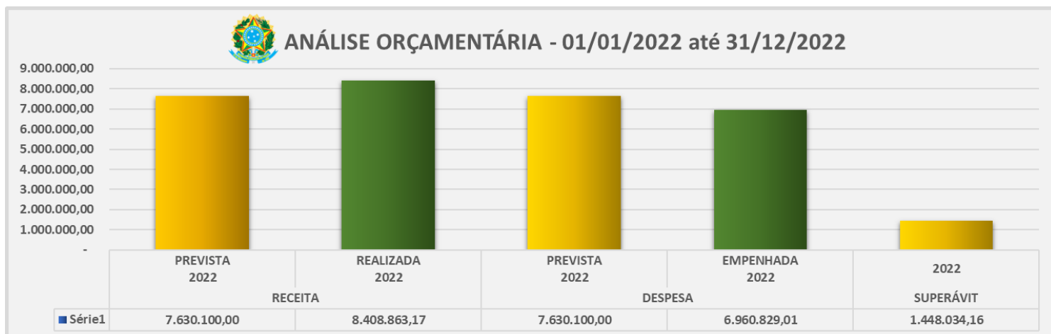
Figura 04 – Análise Orçamentária

Tais controles buscaram uma avaliação maior do seu Orçamento Programa durante o ano de 2022, refletindo nos resultados alcançados e assim demonstrados, bem como seu comparativo em relação ao exercício anterior, para elucidar o resultado de uma gestão voltada para objetivos e metas aplicadas ao longo do ano, evidenciando assim, maior eficiência com os gastos públicos: